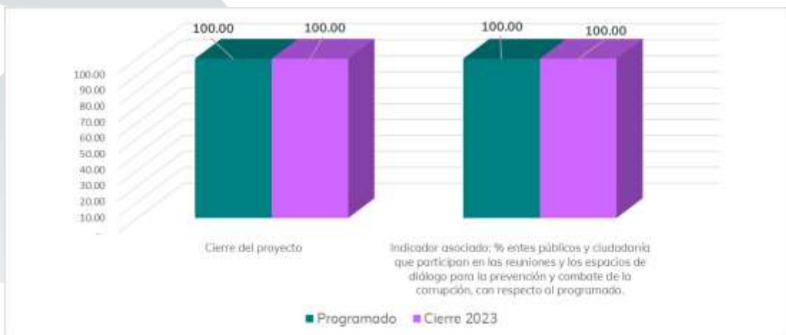
Gráfico 7. Cumplimiento del proyecto transversal 1.2 para el ejercicio 2023

En resumen, con estas acciones se da el cumplimiento de las metas e indicador del proyecto para el ejercicio 2023. Ver gráfico siete.