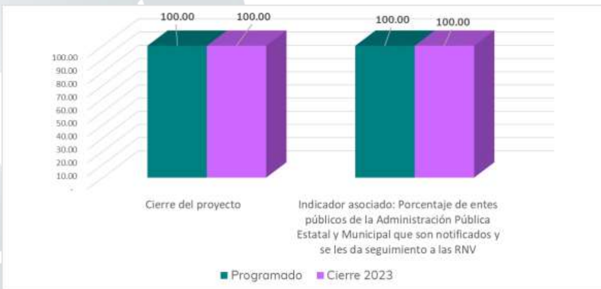
Gráfico 3. Cumplimiento del proyecto 2.1 para el ejercicio 2023.

En resumen, el resultado de estas acciones se refleja en la siguiente gráfica, en la que se indica el cumplimiento de las metas e indicador del proyecto para el ejercicio 2023.