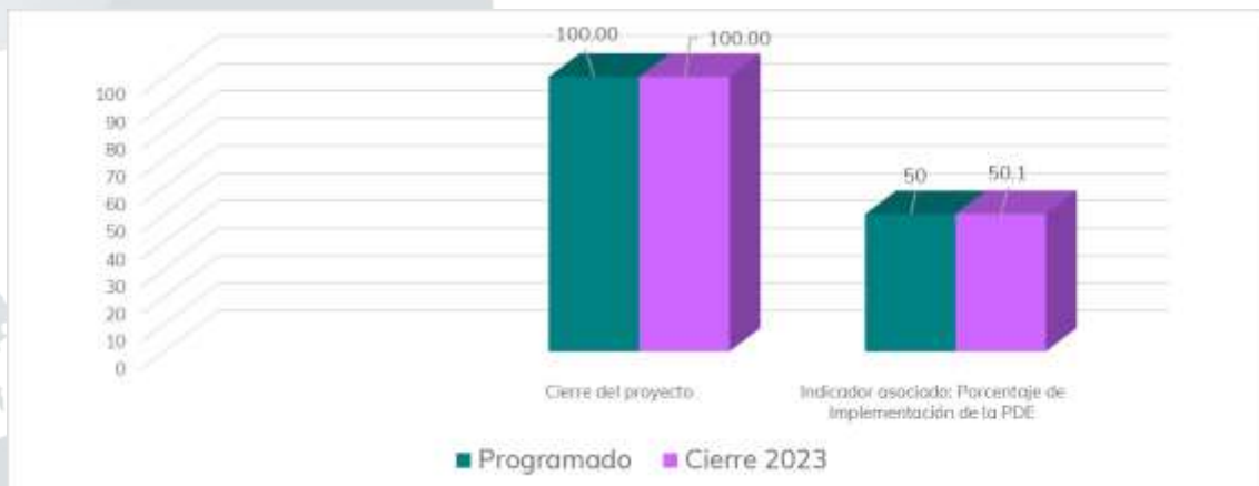
Gráfico 2. Cierre del proyecto 1.2 para el ejercicio 2023.

En resumen, en la gráfica dos se informa el cumplimiento del proyecto e indicador asociado, al cierre del ejercicio 2023.