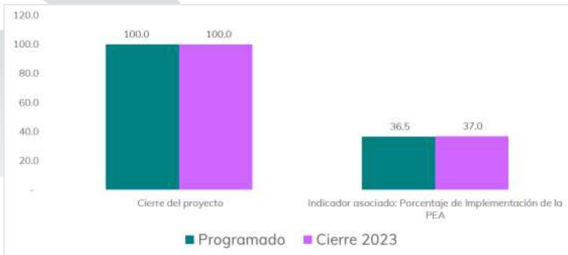
Gráfico 1. Cumplimiento del proyecto 1.1 e indicador para el ejercicio 2023.

En resumen, en la siguiente gráfica se informa el cumplimiento del proyecto e indicador asociado, al cierre del ejercicio 2023.